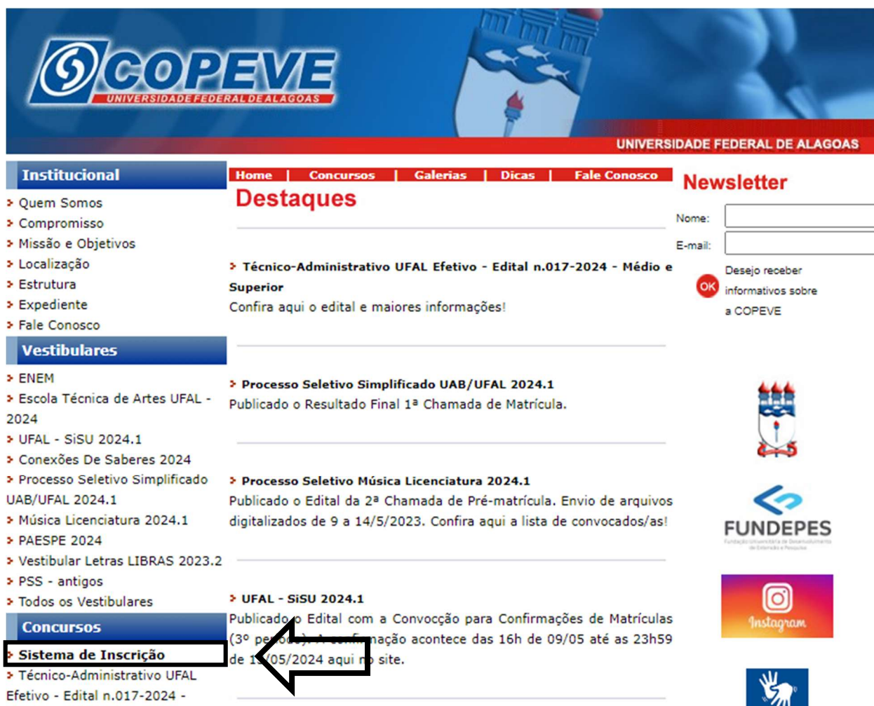
Figura 1 – Acessar Sistema de Inscrição.